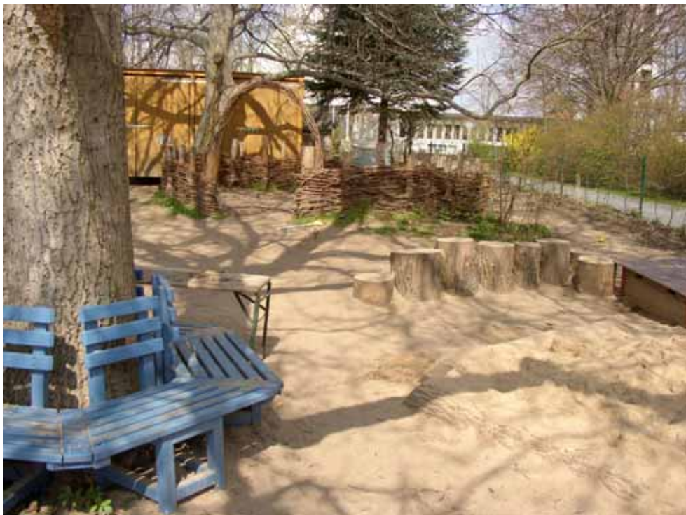
Unser Haus und Garten